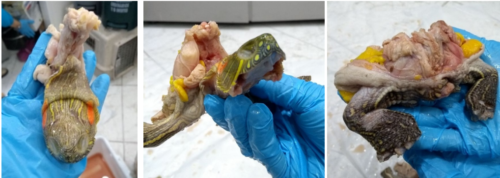
Figura 6. Carne incautada de Tortuga icotea ( Trachemys callirostris ), nótese cabeza, extremidades anteriores y posterior.