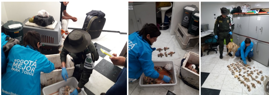
Figura 1. Procedimiento de incautación de 3,912 kg de Trachemys callirostris . Acta Única de Incautación No. 0002991

Al practicarse la verificación por parte del profesional de la Secretaría Distrital de Ambiente, se corroboró que se trataba de 3,912 kg de carne y huevos, cuyas características morfológicas y caracteres diagnósticos descritos en el numeral 4. (CONCEPTO Y ANÁLISIS TÉCNICO), permitieron determinar que pertenecen a la especie ( Trachemys callirostris )– Tortuga Icotea, pertenecientes a la fauna silvestre colombiana (Figura 1).