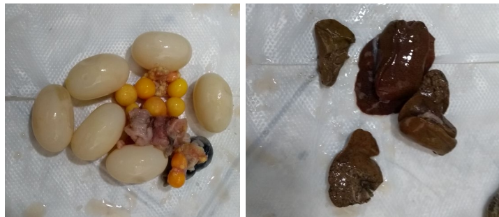
Figura 7. Partes de Tortuga icotea ( Trachemys callirostris ) incautadas, huevos y algunas vísceras.

Evaluación inicial de los subproductos: Evaluación inicial de los subproductos: Se evidencia que se realizó un aprovechamiento ilegal de fauna silvestre en donde se pudo determinar que se hizo una movilización ilegal de una cantidad considerable de carne de tortuga y que dentro de esta se encontró un gran número de huevos pudiendo determinar la afectación de los ciclos reproductivos de la especie en su medio natural y que dicha