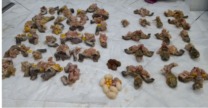
Figura 4 y 5. Carne incautada de Tortuga icotea ( Trachemys callirostris ), nótese cabezas, extremidades anteriores, posteriores y algunas vísceras.